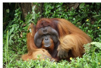
<オランウータン保護区を見学>

今回発売を開始するカリマンタン島バリクパパンコースでは、テルナテ島コース同様に観測地としてサッカー場を確保。周囲には高い建物がなく、視界の開けた絶好の観測エリアをご用意しております。オランウータン保護区見学など、自然との触れ合い豊かな学びの旅をご用意しております。