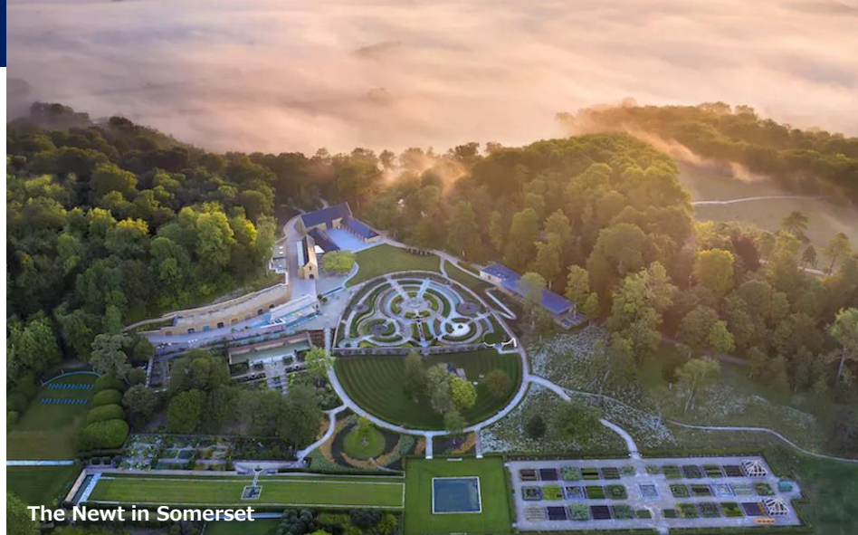
The Newt in Somerset