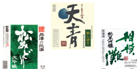
※画像はすべてイメージです。お食事写真は一例です。