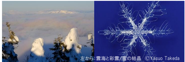
左から:雲海と彩雲・霧の結晶 © Yasuo Takeda

宿泊:横手山頂ヒュッテ 客室:和室(テレビ・トイレ・洗面台・フェイスタオル付) 設備:レストラン・ラウンジ・大浴場・売店・パン屋 ・歯ブラシ・浴衣・バスタオルはご持参ください。 ・防寒具等のレンタルはありません。 ・1月平均気温 横手山頂 最高-7.4℃、最低-14.2℃ 東京地方 最高 9.6℃、最低 0.9℃