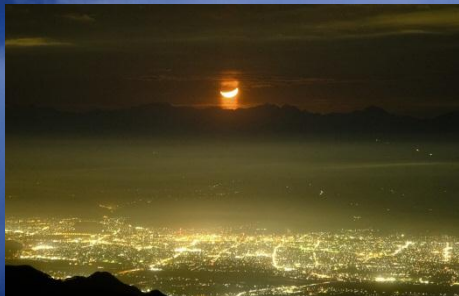
左から: 夜景と月 / 標高2300mの夜明け / 夜明けの樹氷と浅間山・富士山