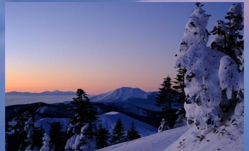
※写真は前回のツアーで撮影されたものでイメージです。