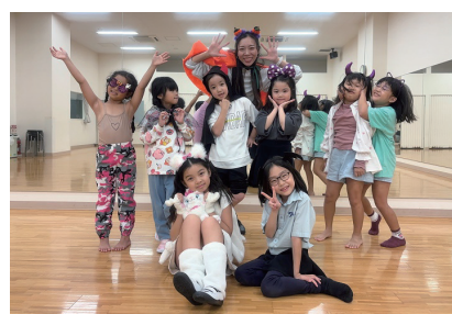
はじめてのk-popダンス