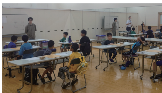
子ども将棋交流戦

茶道・香道の各流派合同の茶会を毎年秋に東京・護国寺で開催しています。日頃のお点前の成果を披露します。(過去43回開催)