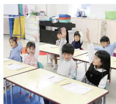
理英会アフタースクール池袋校