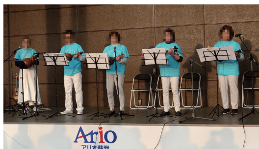
ダンス・音楽発表会

毎年8月に池袋サンシャインシティ地下1階「噴水広場」で開催しています。池袋コミュニティ・カレッジとメゾンカルチャークラブの受講生の他、一般団体も参加する大型イベントです。