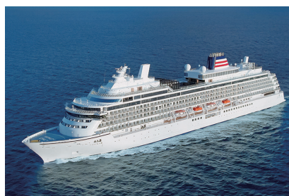
クルーズツアーや希少な 観光列車の旅