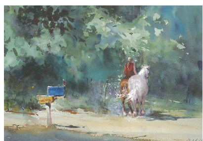
右近としこの透明水彩