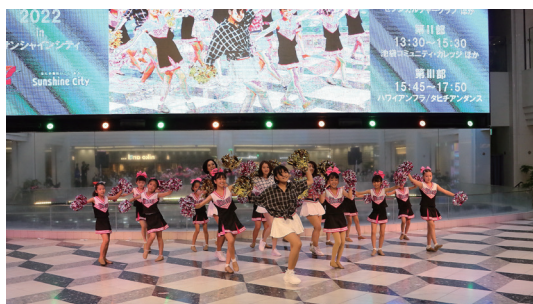
夏のダンスフェスティバル

多くのコート面数と細かいレベル分けにより、参加者一人ひとりがテニスを楽しく学べます。ゲーム練習の他、新しいショットの習得、苦手克服など、初めての方でも安心して楽しめるキャンプです。