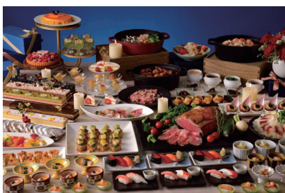
優待料金で食事プランをご提供