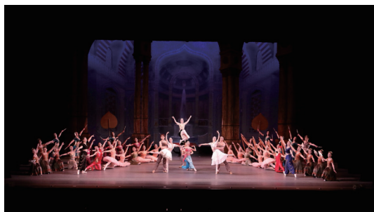
フライングダンシング

メゾンカルチャークラブ17店舗と池袋コミュニティ・カレッジの店舗ネットワークを活かした旬の講座開発により、同じ趣味や目的を持った仲間と知的好奇心を満たし、心の充足を得られる体験の場を提供しています。また店舗合同の発表会やイベントを定期的に行い、日ごろの成果を発揮いただく機会を通して元気あるスクールを目指していきます。