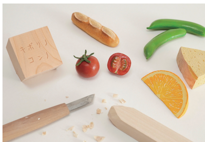
キボリノコンノ木彫り教室