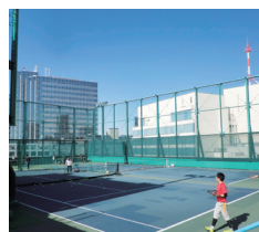
屋上テニスコート